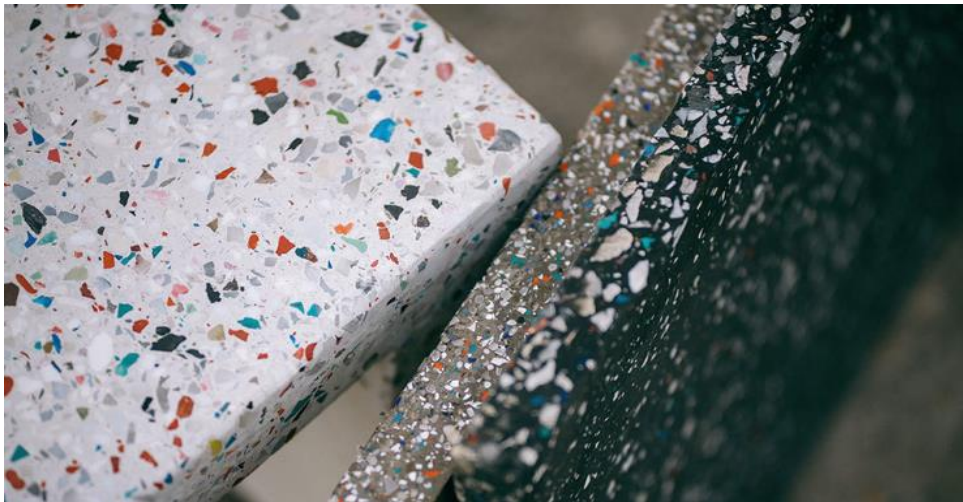
Figura 3. Muestra de los productos de Plásticos de Concreto y Terrazo de MANEO.

El resultado es que pueden reutilizar hasta 300 toneladas de plásticos no reciclables al día de manera neutral en carbono. Sus productos ofrecen características mejoradas en comparación con el concreto y el terrazo tradicionales, incluyendo una reducción de peso de hasta el 50%, mayor resistencia al agua, resistencia a los terremotos y mayor resistencia y flexibilidad.