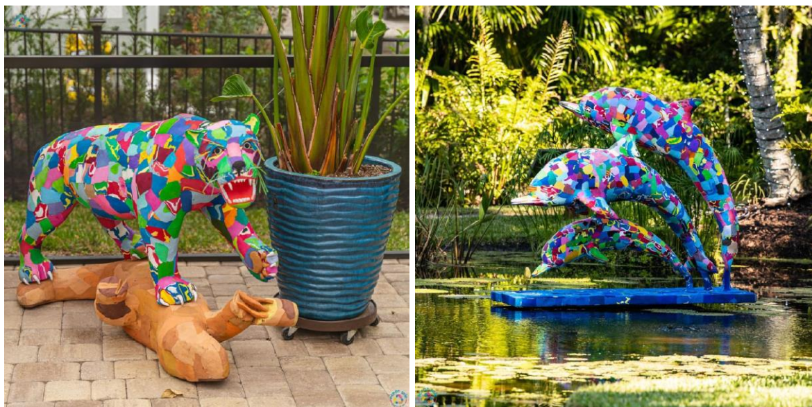
Figura 5. Diseños de revalorización de plástico de Ocean Sole.

En algunos casos, la revalorización del plástico también incluye un propósito artístico. Ocean Sole es una organización no gubernamental (ONG) de Kenia que convierte la contaminación en obras de arte con chanclas. A través de la limpieza de playas, la ONG obtiene las chanclas utilizadas en sus piezas. Los materiales utilizados en la fabricación de chanclas abarcan una amplia gama, incluyendo caucho, espuma de plástico, corcho, plásticos reciclados, poliuretano, acetato de etileno-vinilo (EVA), etc. Sus 90 empleados han ayudado a recuperar cerca de 600 toneladas de chanclas de las playas y han impactado a más de 1.000 personas de comunidades altamente vulnerables.