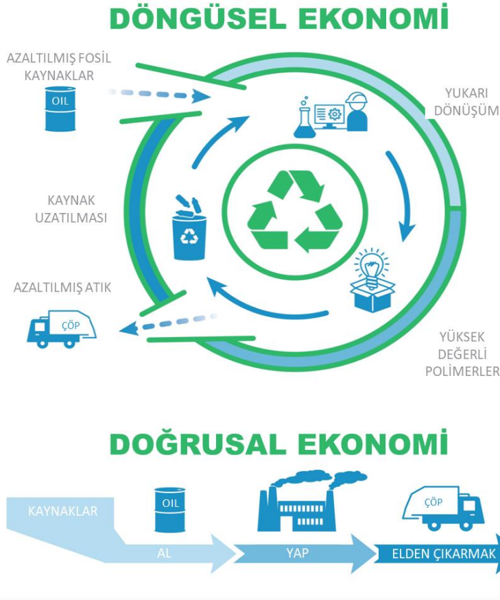
Şekil 3. Plastik endüstrisinde Dögüsel ve Doğrusal Ekonominin karşılaştırılması. Kaynak: Atık Plastiklerin Zorluğu – Daha Dögüsel Bir Ekonomi İçin Çabalamak (Domenic Di Mondo).

Örneğin, plastiğe yeniden değer kazandırmaya yönelik dögüsel perspektif yaklaşımı, giysi yapımında kullanılan geri dönüştürülmüş plastik şişeler gibi geri dönüştürülmüş plastikten yapılmış ürünler tasarlamayı içerebilir. Ek olarak, dögüsel perspektif yaklaşımı, plastik atıkları yakıtla dönüştürmek veya yapı malzemesi olarak kullanmak gibi plastik atıkları yeniden kullanmanın yollarını bulmayı da içerecektir.