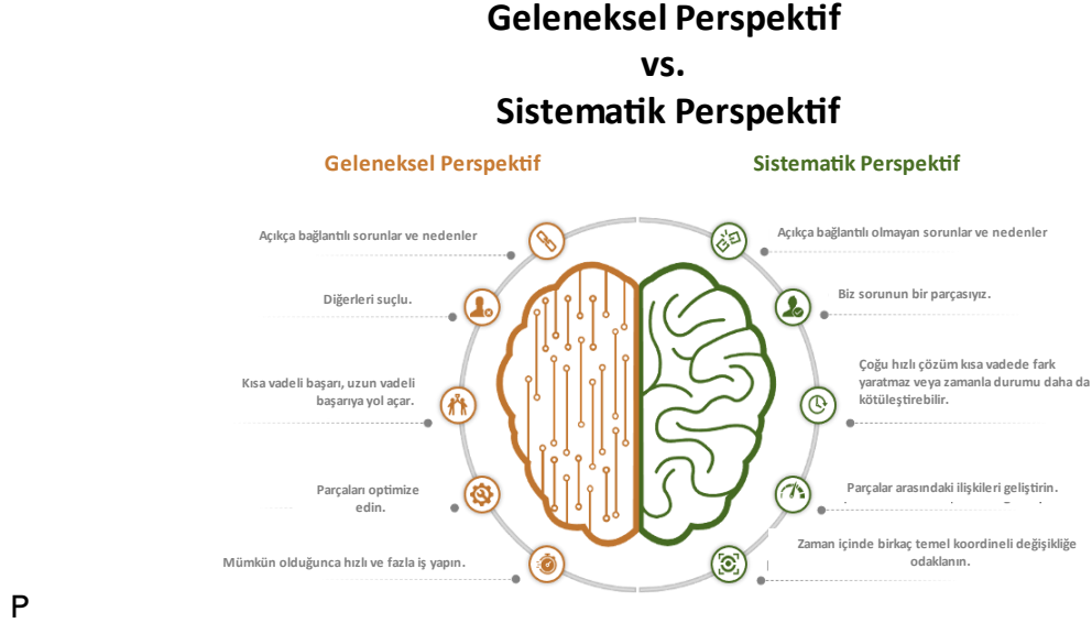
Şekil 2. Konvansiyonel ve sistematik perspektif karşılaştırılması.